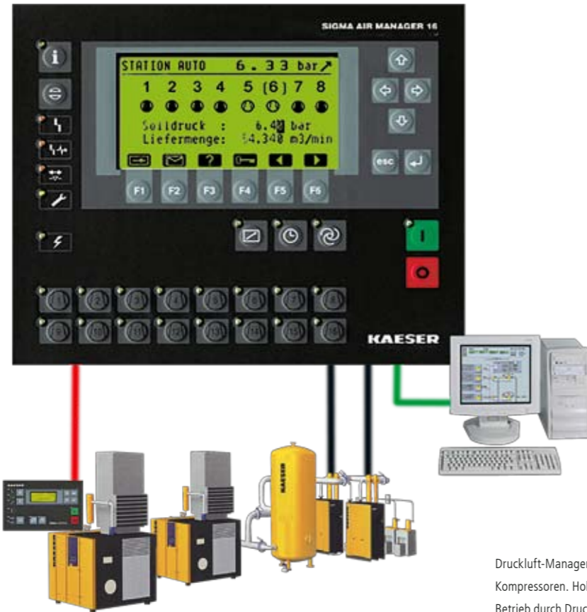
Druckluft-Managementsystem für den Einsatz mehrerer Kompressoren. Hohe Wirtschaftlichkeit und zuverlässiger Betrieb durch Druckbandsteuerung und Erfassung aller relevanten Maschinen- und Gerätedaten.

Es gibt einen guten Grund sich mit der Ökonomie einer Druckluftanlage zu beschäftigen: Geld!