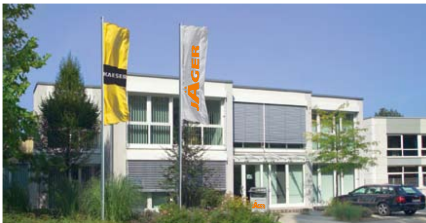
Unser Sitz auf der Siemensstraße in Hilden

Wir sitzen ganz in Ihrer Nähe – in Hilden.